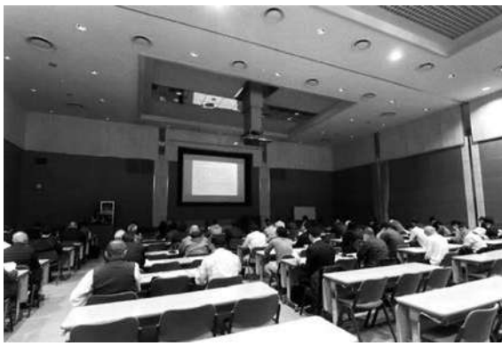
文責 理事 曾我部英司