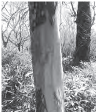
↓シカによる成就地区第二園地のリヨウブの樹皮剥ぎ

更には、自治体や山岳団体等も対応はしておるが、他山同様にシカに樹皮剥ぎされた木も登山道沿いに散見するようになってきた。