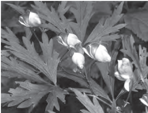
↓シコクブシ(トリカブト)

ルの雪があつたものよ。冬だけじゃのうて、夏場の自然環境も変わつてきよる。七月山開きの時なんぞは、どの奉仕課も先ず火鉢に炭をくべて火を起こすことから一日が始まつたものじゃが、ナント最近では扇風機が要るようになった。はたまた二、三年前には観られなかつた神主さん御用達の麻緒の原料・カラムシや花は綺麗じゃが毒草としても有名なシコクブシ(トリカブト)なんぞもチラホラと生えるようになりよつた。