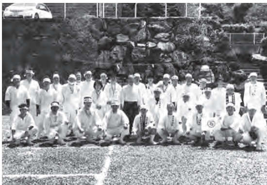
令和5年参加者集合写真

御山開き大祭の、7月1日、10日の御神像奉持に他の組合の皆様も、 ご協力隊として、ご参加できることとなりました。